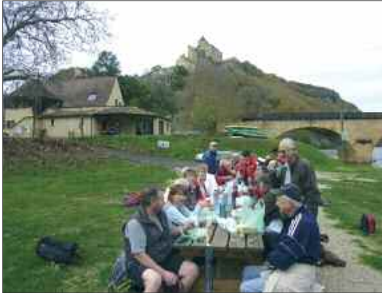
Donner l'envie d'aller plus loin sur le chemin de Saint-Jacques-de-Compostelle

L'association Les Sentiers d'antan a connu un week-end actif et varié. Après l'assemblée générale tenue le vendredi 19 novembre, cent vingt membres se sont retrouvés samedi soir pour partager un repas typiquement périgourdin. Ils étaient enfin trente-quatre dimanche matin à Domme pour prendre le départ de cette première randonnée dominicale en effectuant une étape (Domme/Cladec) de la nouvelle variante du chemin de Saint-Jacques-de-Compostelle ouverte au printemps dernier.