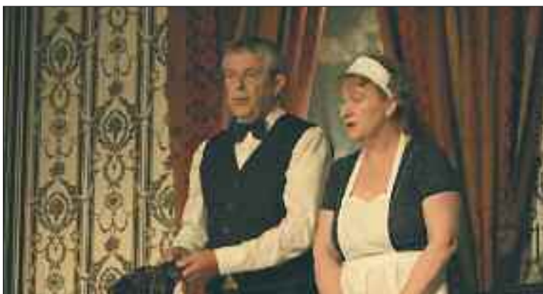
Le duo plébiscité lors de la première