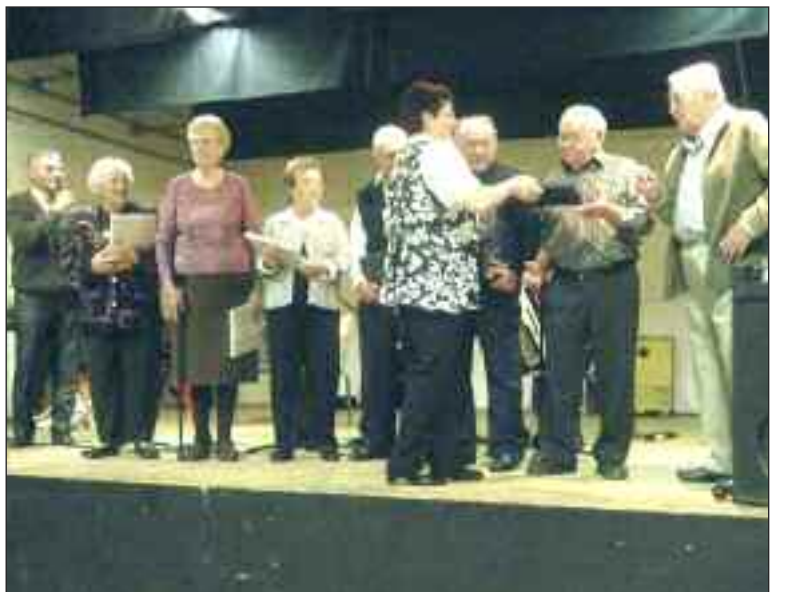
Tous ont reçu leur cadeau