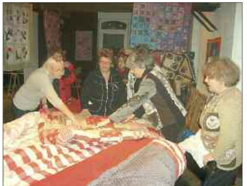
Une bonne idée, faire sa couverture