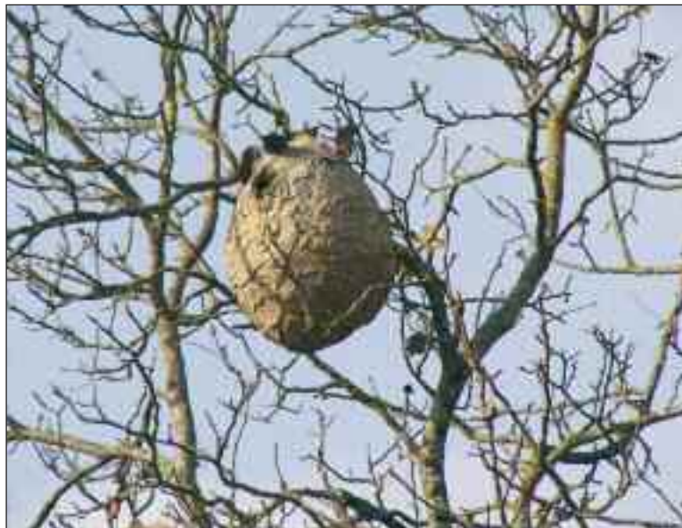
Ce nid se trouve en bordure de la rue du Lieutenant-Giffault

Route de Monpazier, face à l'ancien centre EDF, les passants peuvent découvrir depuis la chute des feuilles, suspendu à une branche, un nid de frelons asiatiques de plus d'un mètre de hauteur occupé par des locataires particulièrement actifs et virulents.