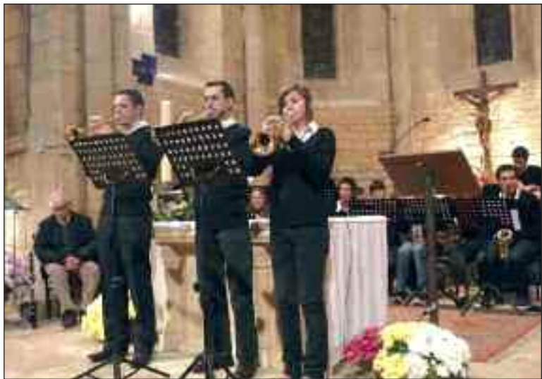
La Saint-Roch a fêté la Sainte-Cécile