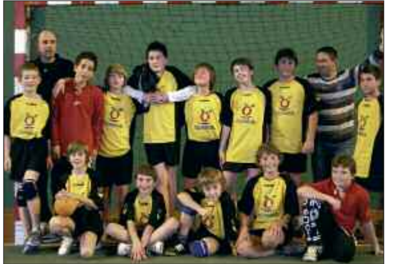
Les moins de 13 ans