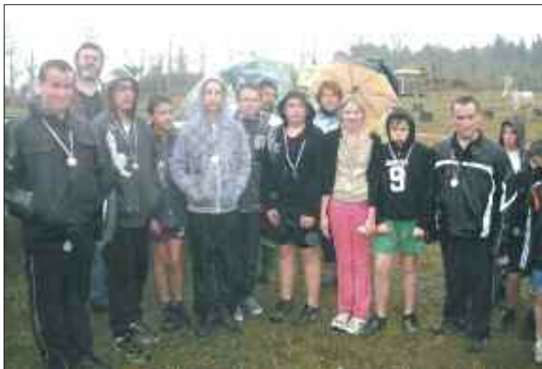
Les élèves belvésois récompensés