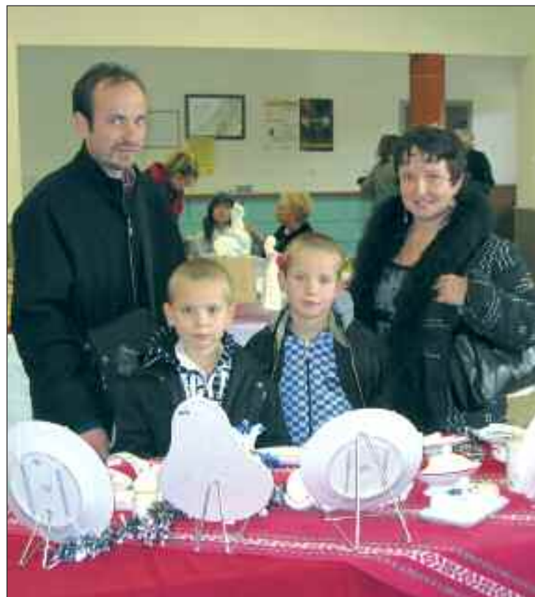
Petits et grands à la recherche du bibelot