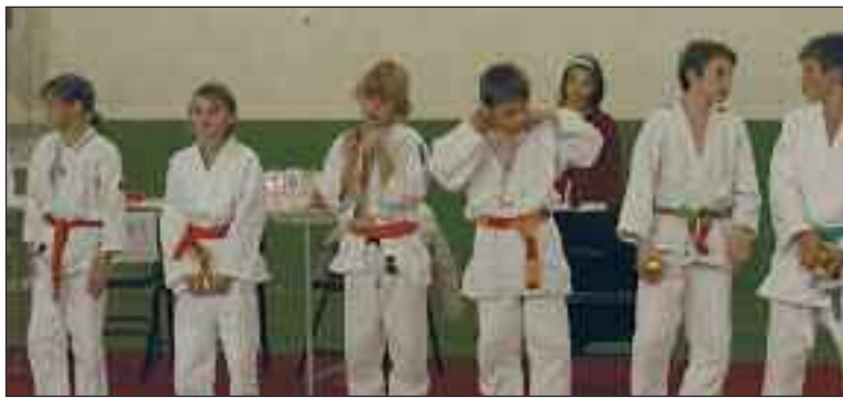
De l'or pour trois futurs champions