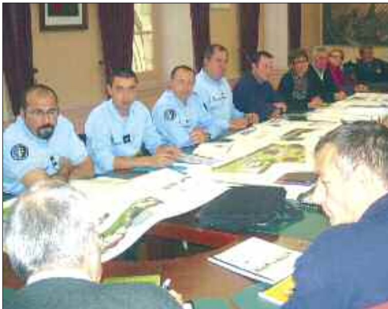
Elus et gendarmes plangent sur le projet