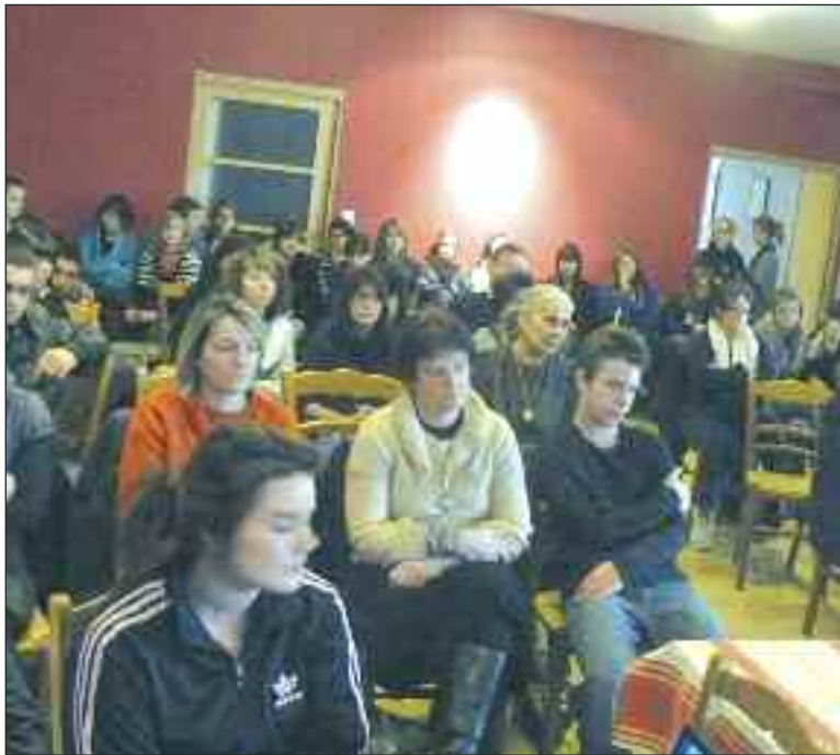
Lors de la réunion